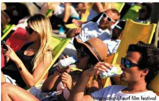
International surf film festival

Du 12 au 14 août. A partir de 30 € le pass journée. Les Cigales, 273, rue des Ecoles, Luxey. musicalarue.com