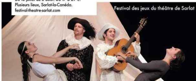
Festival des jeux du théâtre de Sarlat

Du 8 au 15 juillet. 70 € le pass pour tout le festival. Plusieurs lieux, Lège-Cap-Ferret. capferretmusicfestival.com