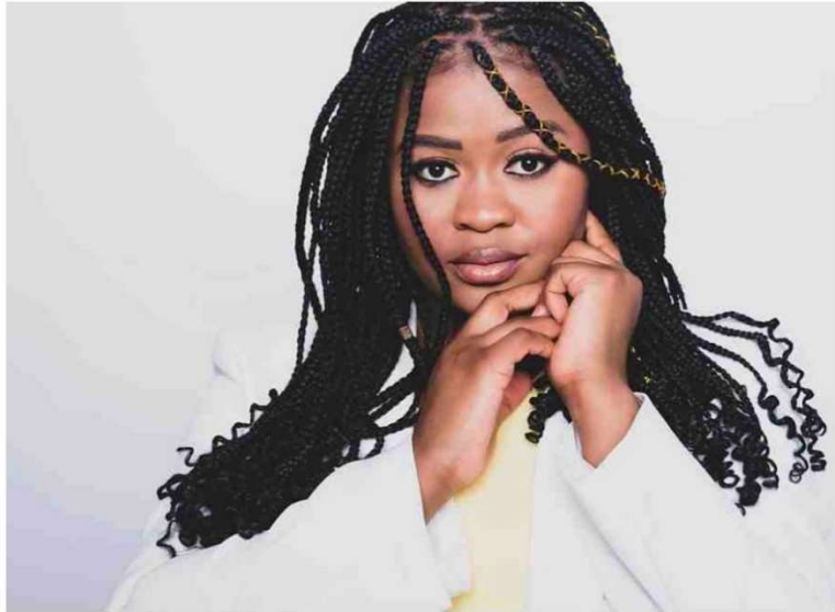
La mezzo-soprano sud-africaine Siphokazi Molteno.

Mais il n'y a pas seulement du piano aux Estivales, il y a même des appariements rares ! Le festival ouvre lundi 1 er juillet au château